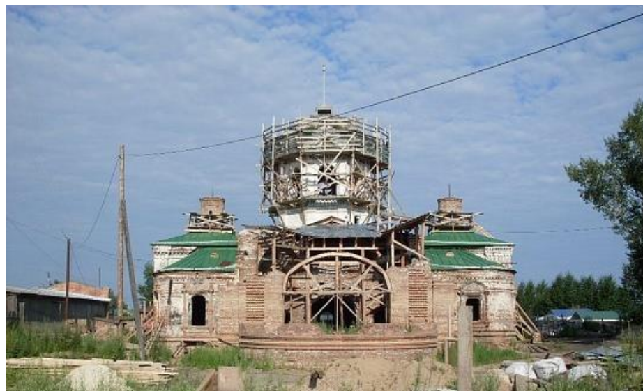
Богоявленский собор 2011 г.