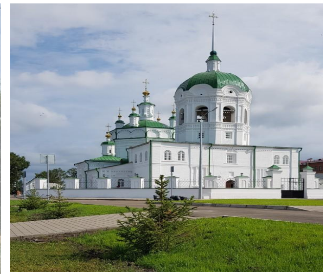
Богоявленский собор 2021 г.