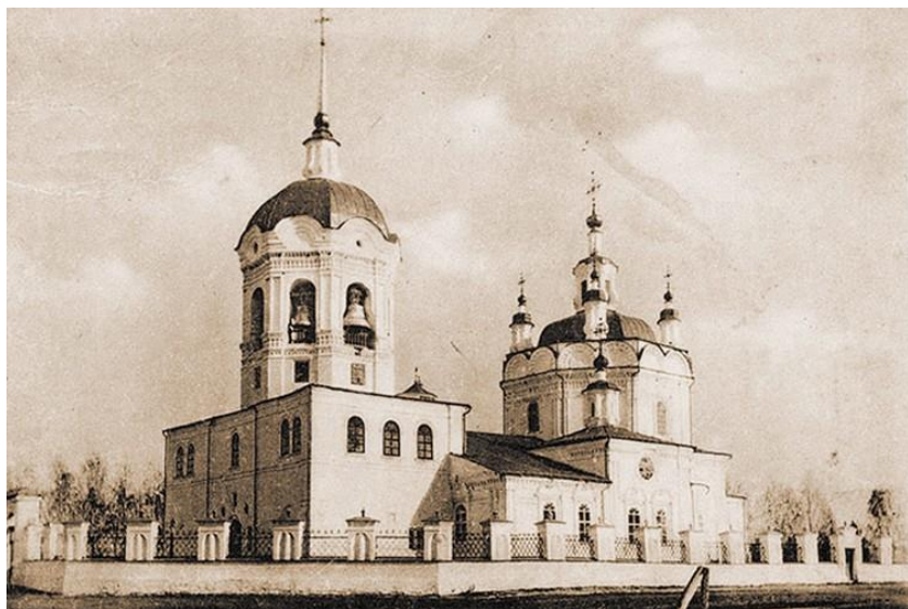
Богоявленский собор 1780 г.