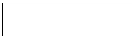
Рисунок 1 - Текст

Текст. Текст. Текст. Текст. Текст. Текст. Текст. Текст. Текст. Текст. Текст. Текст. Текст. Текст. Текст. Текст. Текст. Текст. Текст.